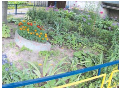
Такой чудесный цветник разбили жители д. 4, пр. Строителей.