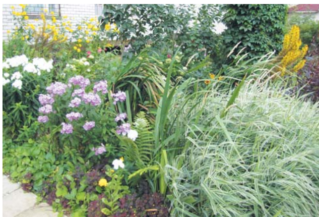
Придомовую территорию облагородили жители д. 6 по ул. Майолик.