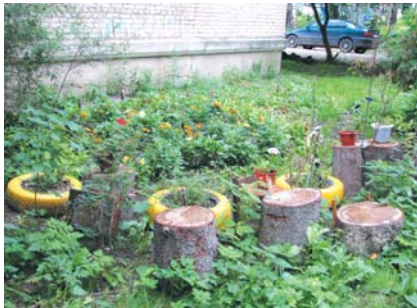
Здесь поработали жители д. 12 по ул. Калинина.

Опубликованный в прошлом номере фоторепортаж "Цветы, цветы..." вызвал шквал телефонных звонков: кто-то приглашал посмотреть на его клумбу, а кто-то просто благодарил за красивые снимки. Сегодня мы продолжаем публикацию фото придомовых клумб, сделанных самими жителями.