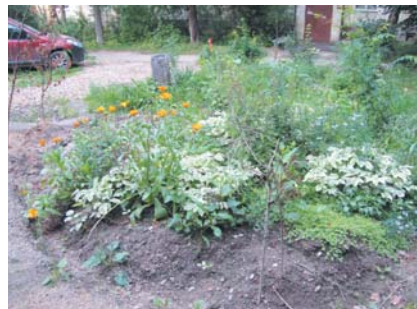
Эта клумба во дворе д. 46 по ул. 2-я Рабочая, и только чудо спасает её от машин на несанкционированной парковке.