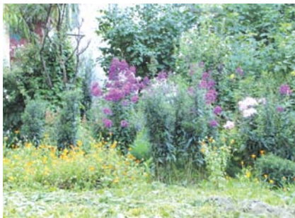
Эти цветы сажает Наталья, жительница д. 5 по ул. Ак. Королёва.