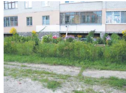
Здесь сажают цветы жители д. 4 по ул. Ак. Королёва.