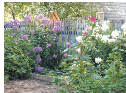
Возле д. 7, корпус 2 по ул. Ак. Королёва есть не только цветник, но и огород, и плодовые деревья.