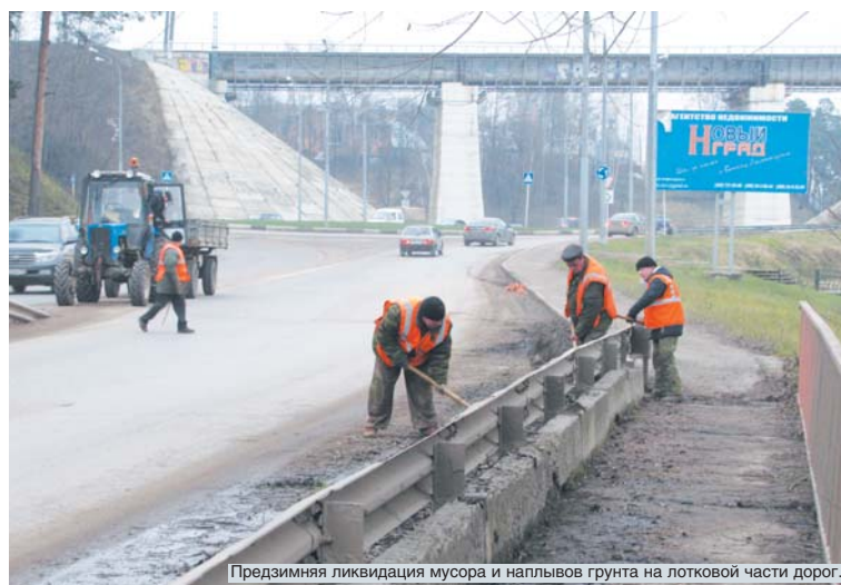
Предзимняя ликвидация мусора и наплывов грунта на лотковой части дорог.

В настоящее время выполняются работы по капитальному ремонту мягкой кровли жилого дома №9 по ул. 3-е Митино, частичному ремонту отмостки жилого дома №24 по ул. 1-й Хотьковской, осушению подвалов после ликвидации засоров канализации в доме №4 по ул. Ак.