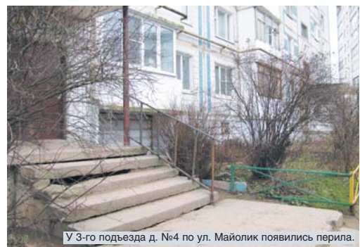
У 3-го подъезда д. №4 по ул. Майолик появились перила.