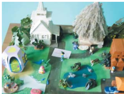
2. Вячеслав Павлов "Осень в городе"