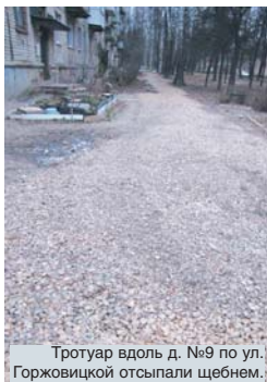
Тротуар вдоль д. №9 по ул. Горжовицкой отсыпали щебнем.