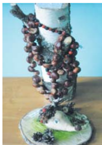
3. Булат Волков "Ёжик" и Алла Болюбаш "Бусы"