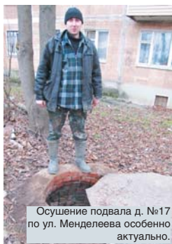
Осушение подвала д. №17 по ул. Менделеева особенно актуально.