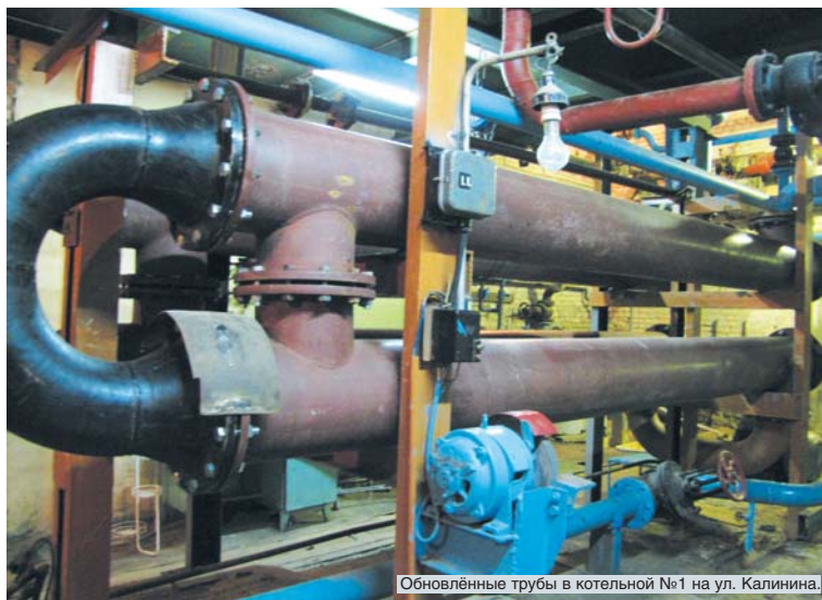
Обновлённые трубы в котельной №1 на ул. Калинина.

Производится восстановление тепловых камер в сетях отопления и горячего во-