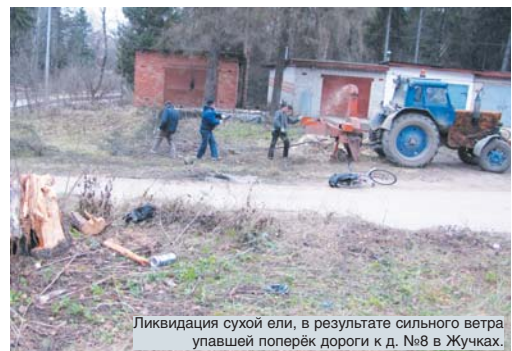
Ликвидация сухой ели, в результате сильного ветра упавшей поперёк дороги к д. №8 в Жучках.