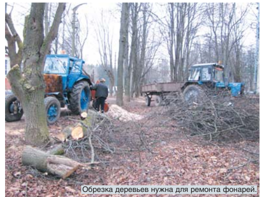
Обрезка деревьев нужна для ремонта фонарей.