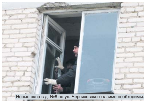
Новые окна в д. №8 по ул. Черняховского к зиме необходимы.