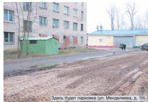
Здесь будет парковка (ул. Менделеева, д. 19).