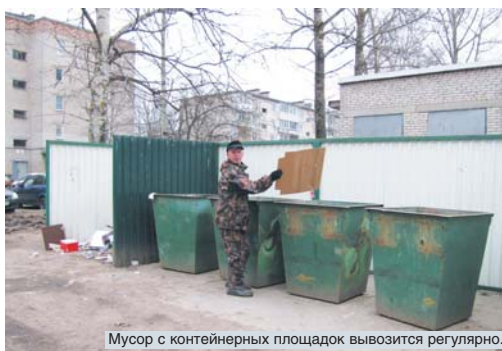
Мусор с контейнерных площадок вывозится регулярно.