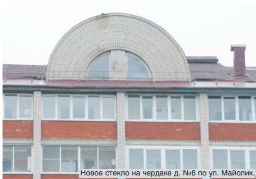
Новое стекло на чердаке д. №6 по ул. Майолик.