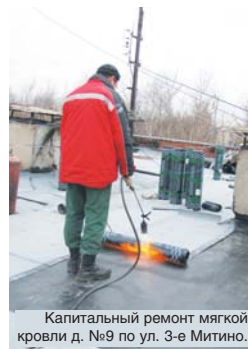
Капитальный ремонт мягкой кровли д. №9 по ул. 3-е Митино.