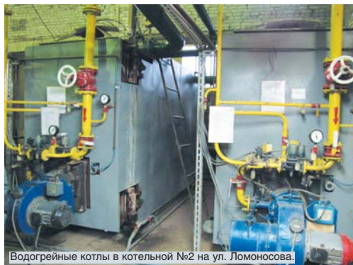
Водогрейные котлы в котельной №2 на ул. Ломоносова.