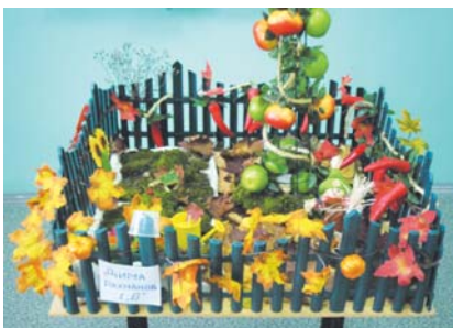
1. Дмитрий Рахманов "Осень на огороде"

Особого внимания удостоились поделки учащихся: