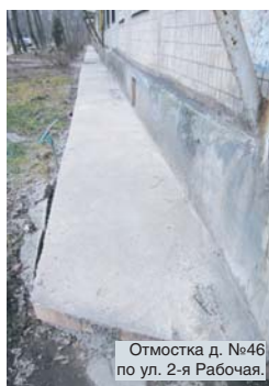
Отмстка д. №46 по ул. 2-я Рабочая.