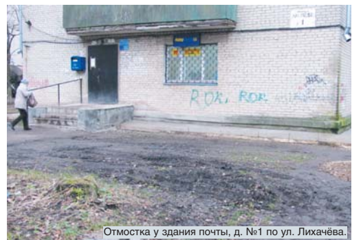
Отмстка у здания почты, д. №1 по ул. Лихачёва.