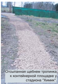
Отсыпанная щебнем тропинка к контейнерной площадке у стадиона "Химик".