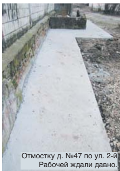
Отмстку д. №47 по ул. 2-й Рабочей ждали давно.