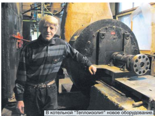
В котельной "Теплоизолит" новое оборудование.