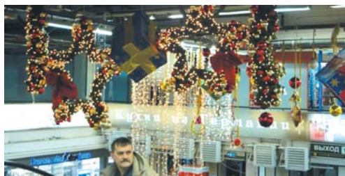
Так украшен гипермаркет "Горбушкин двор" уже 1 декабря

Переберёмся всё-таки в наш город. К сожалению, в Хотькове некоторые предприниматели, а также ГОРПО считают, что нарядные витрины - это всего лишь блажь администрации поселения. Конечно, оно и понятно: отку-