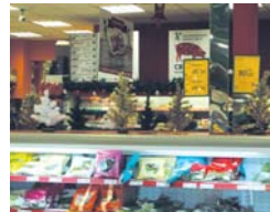
Единственный частный магазин, который достойно украшен. Здесь бизнесмены в курсе, что скоро Новый год

- Конечно, украшать магазины надо - это дает покупателям положительный настрой, они охотнее проводят время в супермаркете, а значит вырастает их покупательская способность. Вообще я думаю, что это хороший рекламный ход, который срабатывает безотказно. Везде в европейских странах витрины украшены уже с 1 ноября, а у нас дай Бог к середине декабря бы все раскачались.