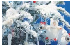
Праздничная витрина в Западном Саффолке.

Это как соревнование: чей офис или витрина украшены пышнее и привлекут больше любопытных взглядов. И не зря! Оказывается, создание настроения и атмосферы праздника положительно влияют на покупательскую способность. Как говорят психологи - это сродни эйфории, когда у человека при взгляде на красиво украшенную витрину поднимается настроение и появляется острая потребность в покупке подарков. Многие американские и европейские ученые знают об этом приеме и даже консультируют бизнесменов, какие выбрать украшения в этот год и как их расположить, чтобы "заманить" покупателя именно в свой торговый павильон. Это отличный рекламный трюк!