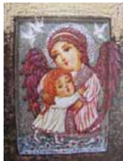
О. Данилова «Ангел-хранитель»