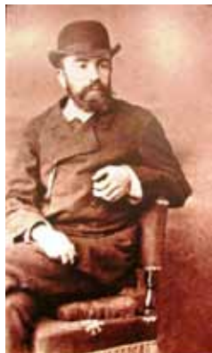
Василию Поленову – (из года 2014 в год 1882)

Над речкой Ворею тогда под Саввиным крылом на долгие возвёл года ты этот дачный дом. Венчал вас Спас, свет и любовь вернув душе твоей. Семью в Абрамцеве обрёл среди творческих людей. Промчался век, идёт второй. Потомки вспомнят всё: и жизнь, прожитую тобой, и творчество твоё. Знать, не случайно завершил путь на берегах Оки. Ведь в полноводности её и Вори родники. В Абрамцево ручьи текут поклонников твоих – от родника испить идут вод чистых и святых.