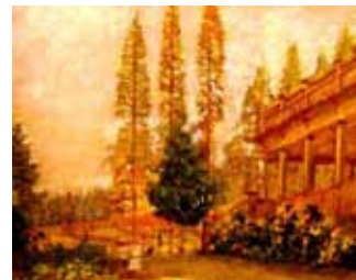
*) картина 1942 года «Дача Машкова в Абрамцеве»