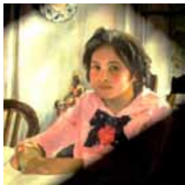
«Девочке с персиками»

Вся пронизана Солнцем, вся, как утро, светла – На минутку присела, персик в руки взяла... Сотня лет пролетела, и вторая идёт. На картине Веруша жизнью вечной живёт.